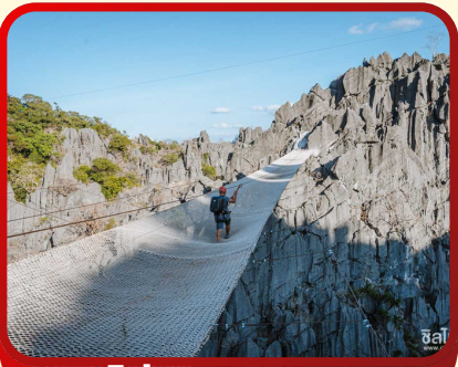
ไต่รังแมงมุม