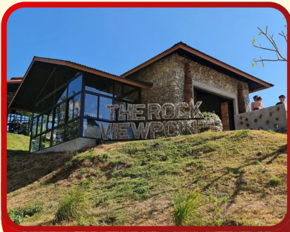
The Rock viewpoint