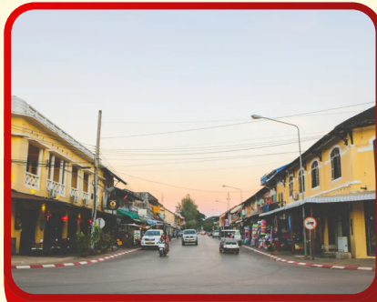
เมืองท่าแขก